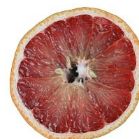
Aromi di pompelmo