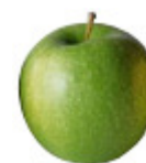
Aromi di mela verde