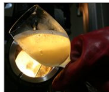
Il vino viene filtrato